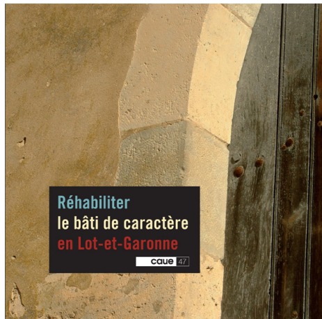
Réhabiliter le bâti de caractère en Lot-et-Garonne

Une collection de 3 livres du Conseil d'Architecture d'Urbanisme et de l'Environnement de Lot-et-Garonne