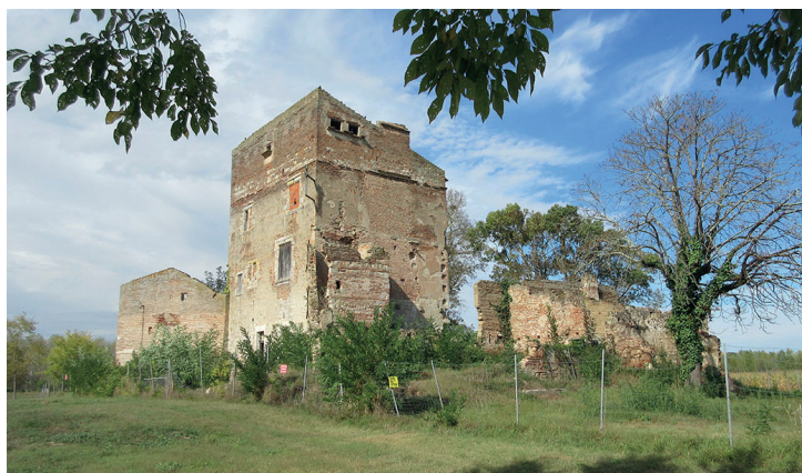
La tour Lacassagne avant travaux - ©Pronaos ▲

Aménagée dans une ancienne tour de guet du XIV e siècle, la Maison de Garonne, inaugurée ce printemps, accueille un centre d'observation et d'interprétation de la Garonne et de ses abords.