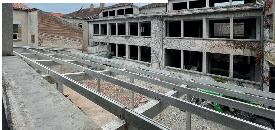
▲ La friche Audevard prête à accueillir les premiers ouvrages ©Compagnie Architecture