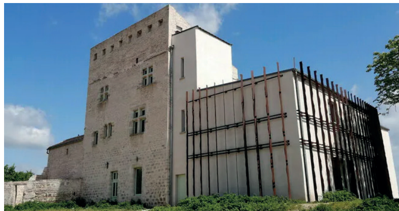
▼ Après les travaux - La Maison Garonne

Le projet a pris forme à Boé Village, sur le site de la Tour Lacassagne acquise en 2001 par la commune. Cette dernière a fait l'objet d'études historiques et archéologiques qui situent sa construction dans la seconde moitié du XIV ème par la famille Lacassagne, très influente sur Agen et dont l'un des membres fut consul.