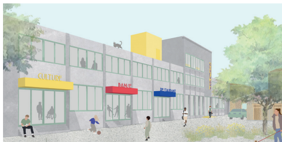
◀ Collage façade Est